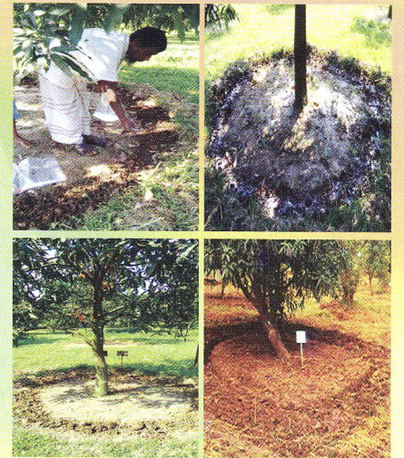
আম গাছে সার প্রয়োগ পদ্ধতি