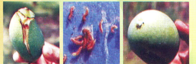
ফলছিদ্রকারী পোকাকার কীড়া