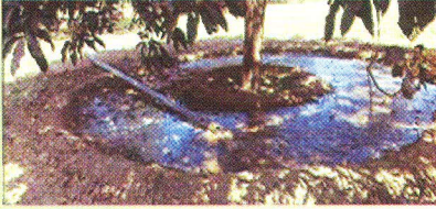
পরিবর্তিত বেসিন পদ্ধতিতে সেচ প্রয়োগ