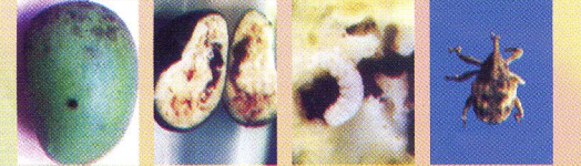
আমের উইভিল পোকা ও তাদের আক্রমণ

সাধারণত: দেশের উত্তর দক্ষিণাঞ্চলের জেলাসমূহে বীজ থেকে জন্মানো আম গাছের ফল উইভিল পোকা দ্বারা আক্রান্ত হয়ে থাকে। মার্বেল আকৃতির আমে স্ত্রী পোকা মুখের শূঁড়ের সাহায্যে চিরে তার মধ্যে ডিম পাড়ে। ফল বড় হতে থাকলে এ ক্ষত চিহ্ন আস্তে আস্তে মিশে যায়। ডিম ফুটে কীড়া বের হয় এবং ফলের শাঁসের মধ্যে আঁকাবাঁকা সুড়ংগ তৈরী করে খেতে থাকে। পূর্ণ বয়স্ক পোকা ফল ছিদ্র করে বের হয়ে আসে।