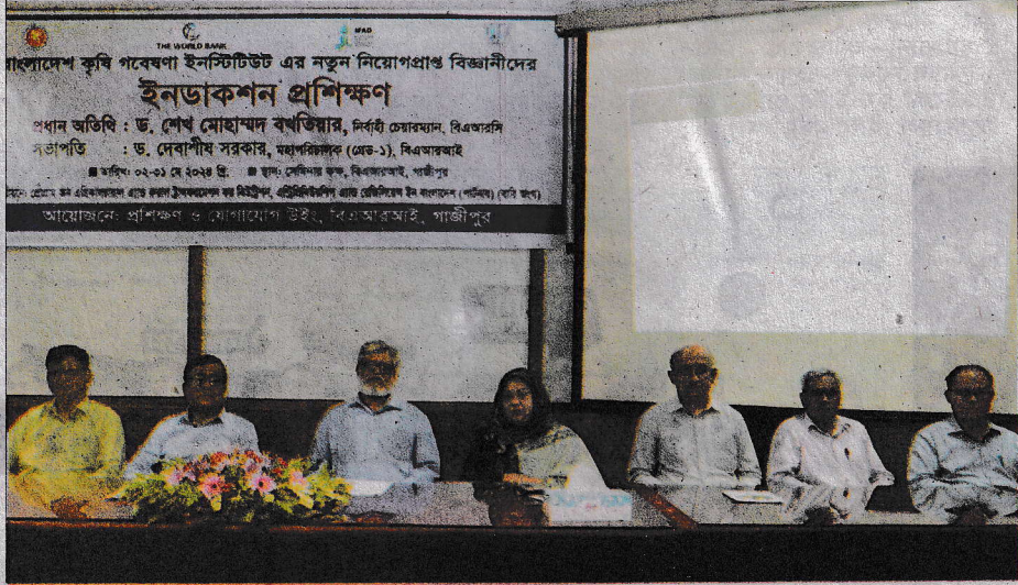
বাংলাদেশ কৃষি গবেষণা ইনস্টিটিউট এর সেমিনার রুমে গতকাল বারির নতুন নিয়োগপ্রাপ্ত বিজ্ঞানীদের জন্য মাসব্যাপী ইনডাকশন প্রশিক্ষণের উদ্বোধনী অনুষ্ঠানে অতিথিরা। বিজ্ঞপ্তি