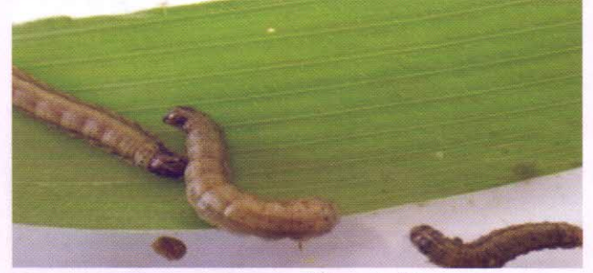
ভুট্টা ফসলে ফল আর্মিওয়ার্মের কীড়া