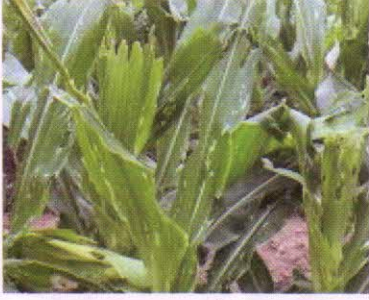
ভুট্টা ফসলে আক্রমণ