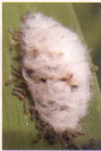
সদ্য প্রস্ফুটিত কীড়া