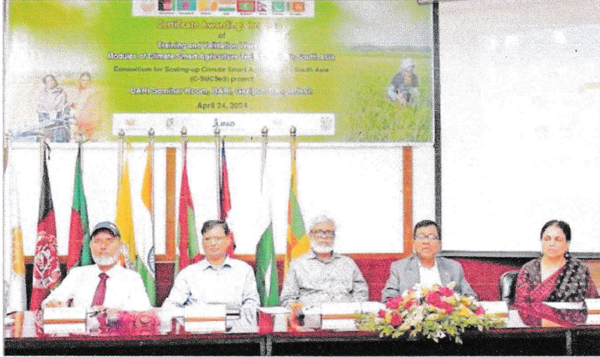
বাংলাদেশ কৃষি গবেষণা ইনস্টিটিউটে সার্ক এগ্রিকালচার সেন্টারের আয়োজনে ইনস্টিটিউটের সেমিনার কক্ষে গতকাল 'সার্ক অঞ্চলে ক্লাইমেট স্মার্ট এগ্রিকালচার টেকনোলজি বিষয়ক' সমাপনী কর্মশালায় অতিথিরা। আমার সংবাদ