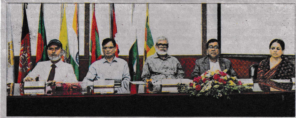
বাংলাদেশ কৃষি গবেষণা ইনস্টিটিউটের সেমিনার কক্ষে সার্ক এগ্রিকালচার সেন্টারের আয়োজনে অনুষ্ঠিত 'সার্ক অঞ্চলে ক্লাইমেট স্মার্ট এগ্রিকালচার টেকনোলজিসবিষয়ক' সমাপনী কর্মশালায় অতিথিরা। বিজ্ঞপ্তি